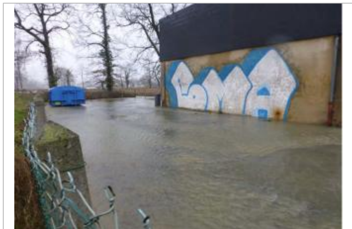
Vue du repère durant la crue - Auteur : Éléments Ingénieries

SOURCE DE REPÉRAGE : ENQUÊTE DE TERRAIN ÉLÉMENTS INGÉNIERIES - SAFEGE POUR LA DDTM 64 - 25/01/2014