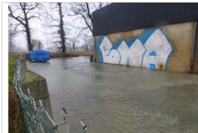
Vue du repère durant la crue

SOURCE DE REPÉRAGE : ENQUÊTE DE TERRAIN ÉLÉMENTS INGÉNIERIES - SAFEGE POUR LA DDTM 64 - 25/01/2014