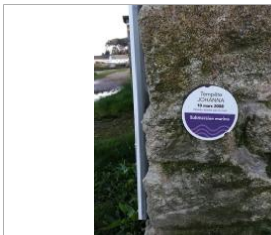
repère normalisé de la submersion marine du 10 mars 2008 - Tempête Johanna