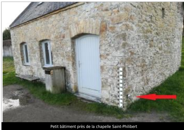
Petit bâtiment près de la chapelle Saint-Philibert