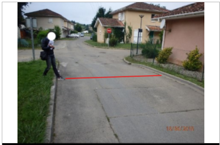
Vue du repère (le trait rouge représente le niveau atteint par les eaux)

GÉNÉRAL Code : WEB_R_202203175204 Date de mise à jour : 17/03/2022 Auteur : SMBGP