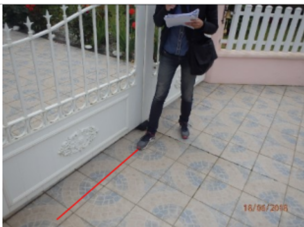
Vue du repère (le trait rouge représente le niveau atteint par les eaux) - Auteur : Artelia/DDTM

Altitude calculée de l'eau (en m) : 105.6 m