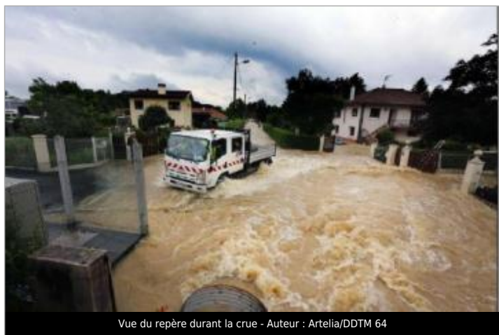
Vue du repère durant la crue