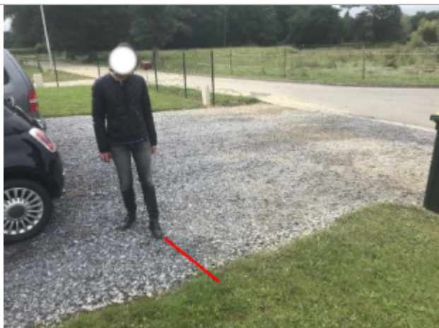
Vue du repère (le trait rouge représente le niveau atteint par les eaux)