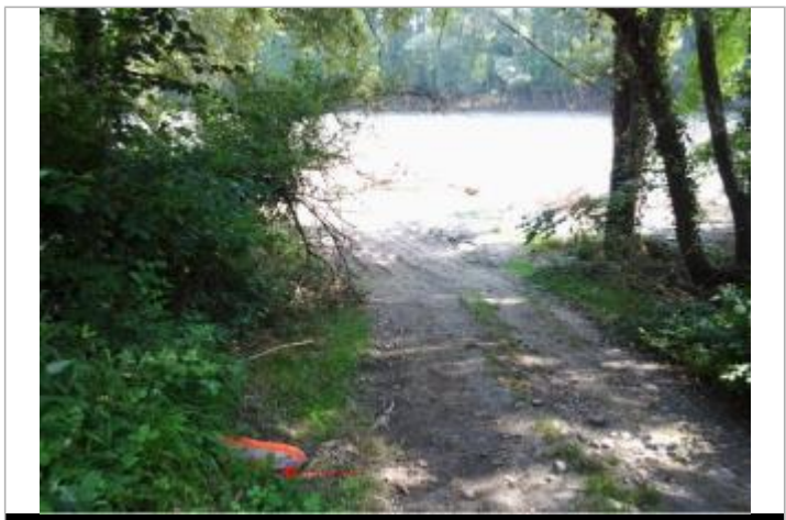
Vue du repère (la marque orange représente le niveau atteint par les eaux)

GÉNÉRAL Code : WEB_R_202203163307 Date de mise à jour : 16/03/2022 Auteur : SMBGP