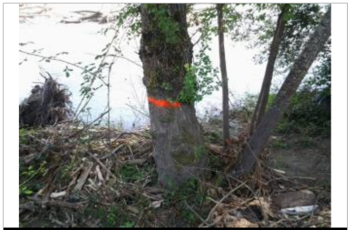
Vue du repère (le trait orange représente le niveau atteint par les eaux)

GÉNÉRAL Code : WEB_R_202203161411 Date de mise à jour : 24/06/2026 Auteur : SMBGP