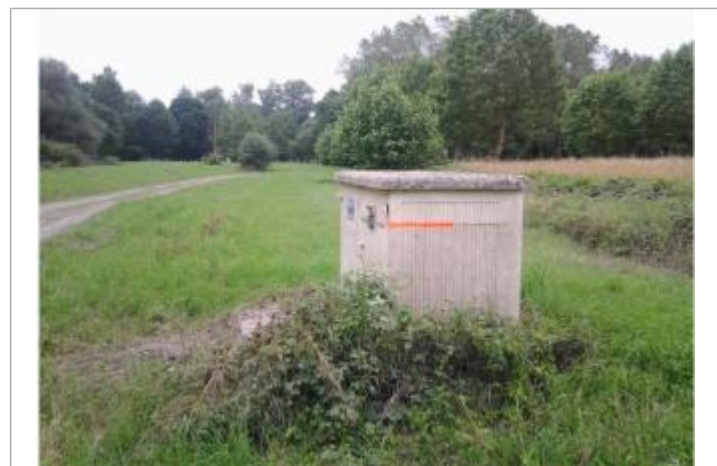
Vue du repère (le trait orange indique le niveau atteint par les eaux)

GÉNÉRAL Code : WEB_R_202203160824 Date de mise à jour : 16/03/2022 Auteur : SMBGP