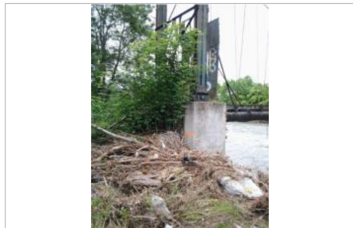
Vue du repère (le trait orange représente le niveau atteint par les eaux) - Auteur : HEA/DDTM 64