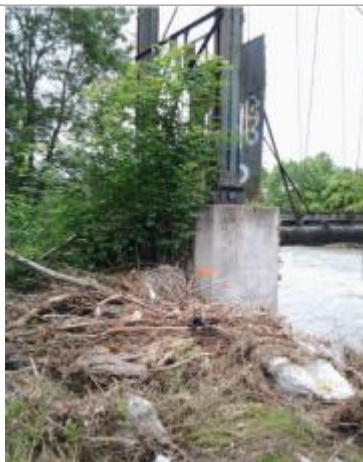
Vue du repère (le trait orange représente le niveau atteint par les eaux)