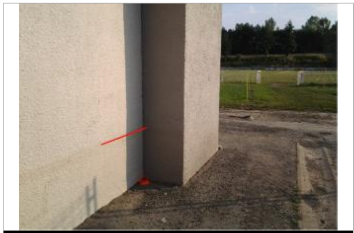
Vue du repère (le trait orange indique le niveau atteint par les eaux)

GÉNÉRAL Code : WEB_R_202203164104 Date de mise à jour : 16/03/2022 Auteur : SMBGP