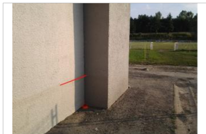
Vue du repère (le trait orange indique le niveau atteint par les eaux)