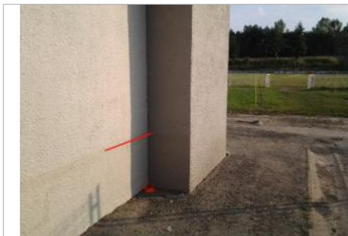
Vue du repère (le trait orange indique le niveau atteint par les eaux)