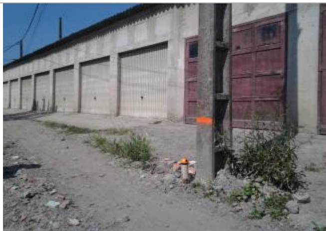
Vue du repère (le trait orange représente le niveau atteint par les eaux)

Altitude calculée de l'eau (en m) : 175.41