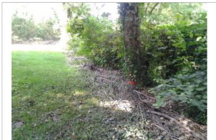
Vue du repère (la trace orange indique le niveau atteint par les eaux)