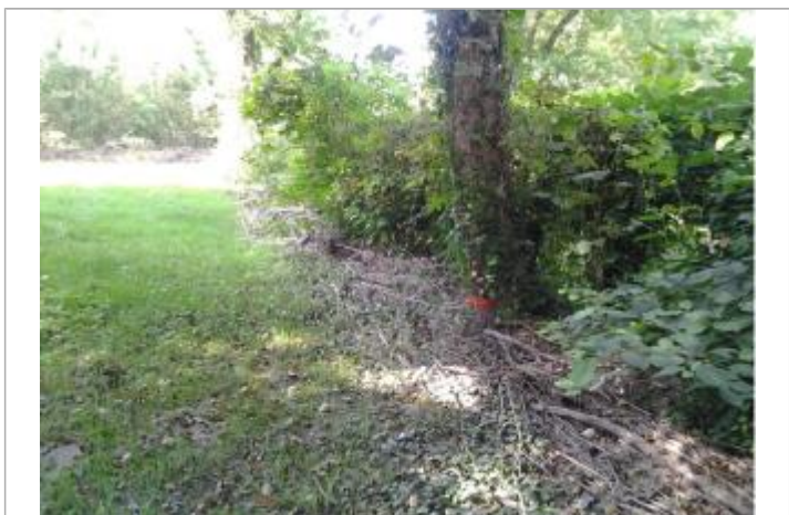
Vue du repère (la trace orange indique le niveau atteint par les eaux)