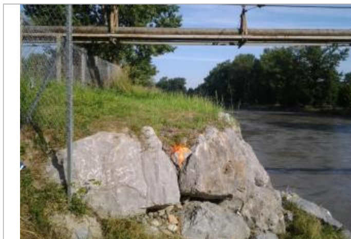
Vue du repère (la trace orange représente le niveau atteint par les eaux)

Code : WEB_R_202203163444 Date de mise à jour : 12/07/2023 Auteur : SMBGP