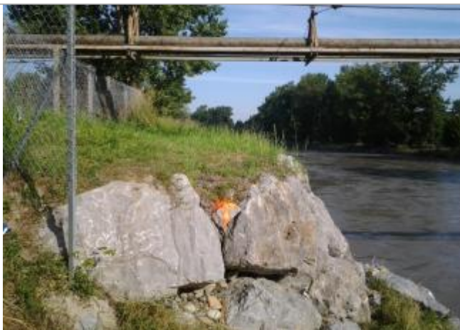
Vue du repère (la trace orange représente le niveau atteint par les eaux)