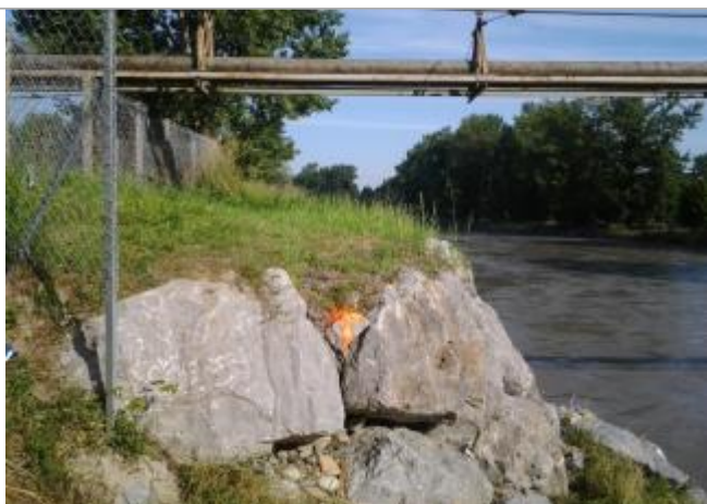
Vue du repère (la trace orange représente le niveau atteint par les eaux)

Altitude calculée de l'eau (en m) : 166.75