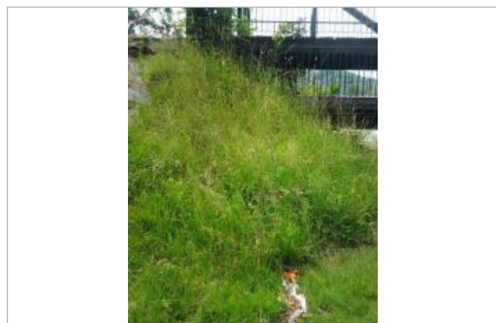
Vue du repère (la trace orange représente le niveau atteint par les eaux)