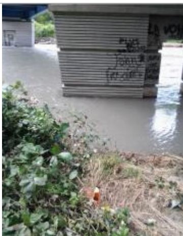
Vue du repère (l'eau a atteint le pied du piquet orange)