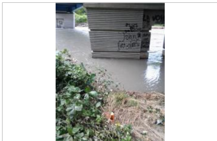
Vue du repère (l'eau a atteint le pied du piquet orange)

Code : WEB_R_202203160815 Date de mise à jour : 16/03/2022 Auteur : SMBGP