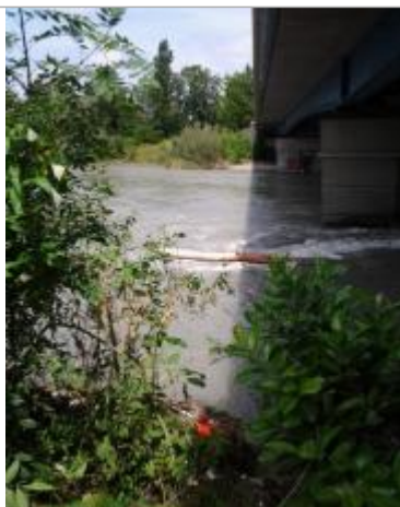
Vue du repère (le trait orange représente le niveau atteint par les eaux)