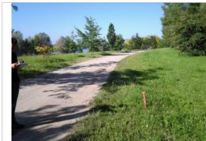
Vue du repère (l'eau a atteint le pied di piquet orange) - Auteur : HEA/DDTM 64

Altitude calculée de l'eau (en m) : 154.01 m