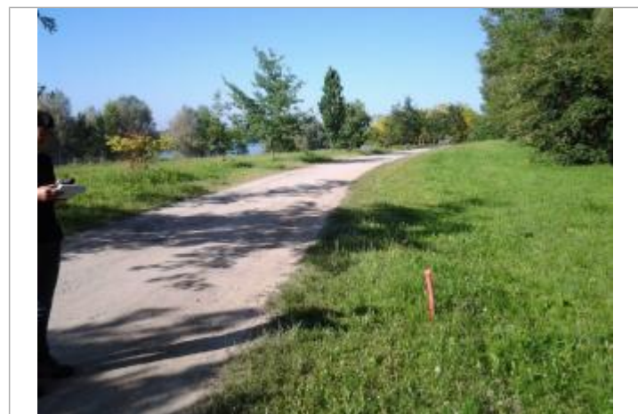
Vue du repère (l'eau a atteint le pied de piquet orange)