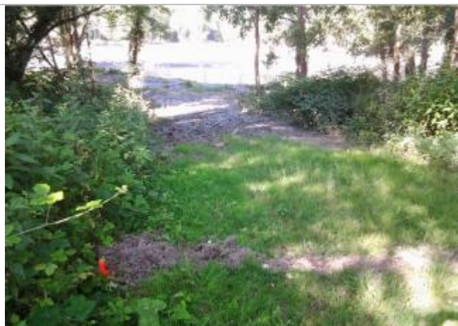
Vue du repère (l'eau a atteint le pied du piquet orange) - Auteur : HEA/DDTM64

Altitude calculée de l'eau (en m) : 152.62 m