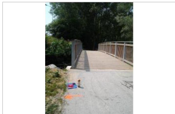
Vue du repère (la flèche orange indique le niveau atteint par les eaux) - Auteur : HEA/DDTM64

GÉNÉRAL Code : WEB_R_202203164259 Date de mise à jour : 16/03/2022 Auteur : SMBGP