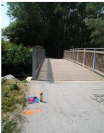
Vue du repère (la flèche orange indique le niveau atteint par les eaux)