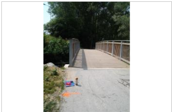
Vue du repère (la flèche orange indique le niveau atteint par les eaux)

GÉNÉRAL Code : WEB_R_202203164259 Date de mise à jour : 16/03/2022 Auteur : SMBGP