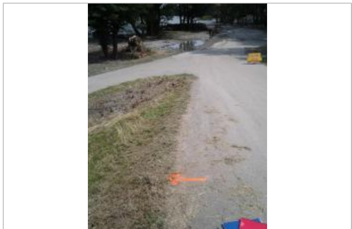
Vue du repère (la flèche orange représente le niveau atteint par les eaux)

GÉNÉRAL Code : WEB_R_202203163549 Date de mise à jour : 16/03/2022 Auteur : SMBGP