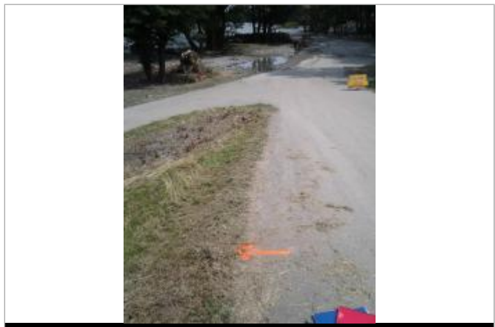
Vue du repère (la flèche orange représente le niveau atteint par les eaux)

GÉNÉRAL Code : WEB_R_202203163549 Date de mise à jour : 16/03/2022 Auteur : SMBGP