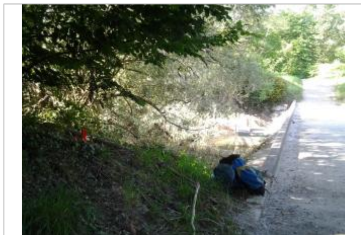
Vue du repère (les eaux ont atteint le pied du piquet orange)

Référence nivelée : Marque d'inondation Système altimétrique : NGF IGN 1969 (système normal) Altitude de la référence (en m) : 150.630 m Altitude calculée de l'eau (en m) : 150.63 m