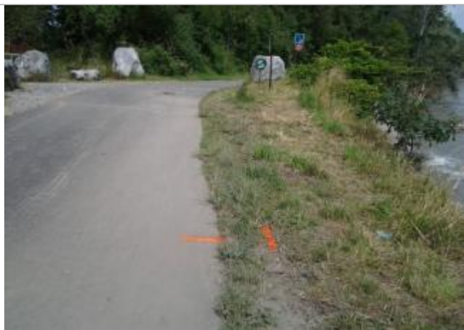
Vue du repère (le trait orange représente la limite de l'inondation)