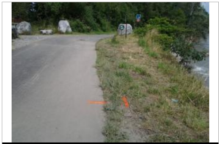
Vue du repère (le trait orange représente la limite de l'inondation)