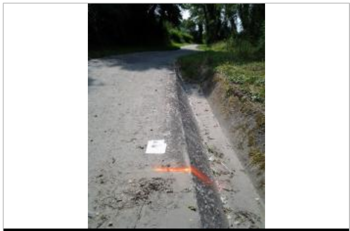
Vue du repère (le trait orange représente la limite de l'inondation)

GÉNÉRAL Code : WEB_R_202203161416 Date de mise à jour : 16/03/2022 Auteur : SMBGP