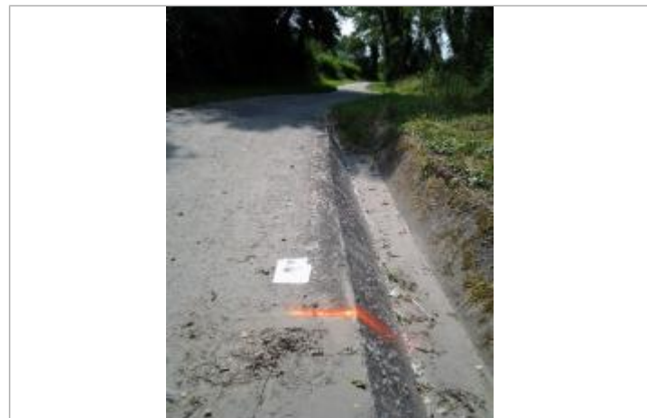
Vue du repère (le trait orange représente la limite de l'inondation)

GÉNÉRAL Code : WEB_R_202203161416 Date de mise à jour : 24/06/2026 Auteur : SMBGP