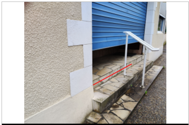
Vue du repère (le trait rouge représente le niveau atteint par les eaux)

Maximum de l'inondation : Oui Visibilité : Non renseigné État du repère : Disparu Pérennité : Aucune Repère calculé : Non PHEC : Non renseigné