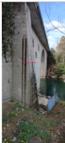
Vue du repère (le trait rouge représente le niveau atteint pas les eaux)