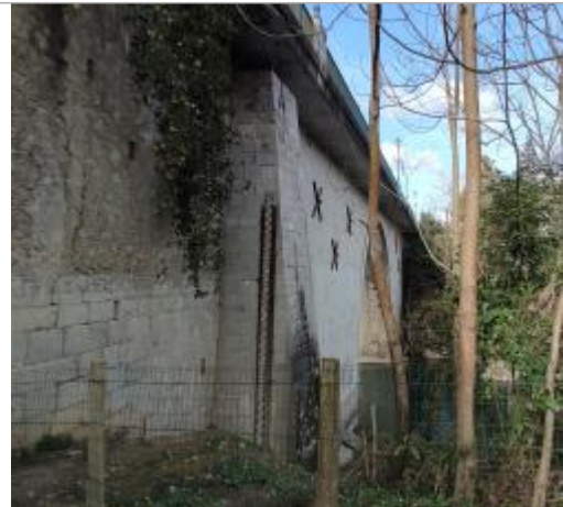
Vue de l'échelle - Auteur : SMBGP