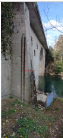
Vue du repère (le trait rouge représente le niveau atteint pas les eaux)

Type de repérage : Source bibliographique