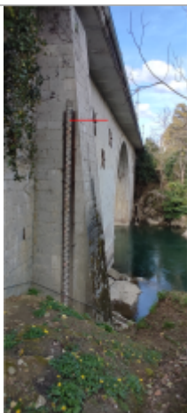
Vue du repère (le trait rouge représente le niveau atteint pas les eaux)

Type de repérage : Source bibliographique