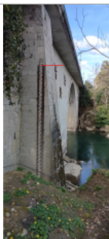
Vue du repère (le trait rouge représente le niveau atteint pas les eaux) - Auteur : SMBGP

Type de repérage : Source bibliographique