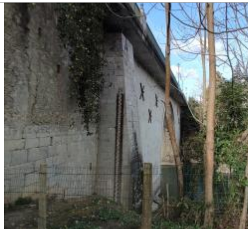
Vue de l'échelle - Auteur : SMBGP