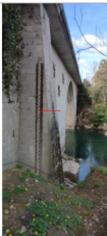
Vue du repère (le trait rouge représente le niveau atteint pas les eaux)

Type de repérage : Source bibliographique