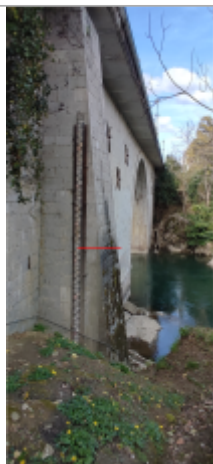
Vue du repère (le trait rouge représente le niveau atteint pas les eaux)

Type de repérage : Source bibliographique