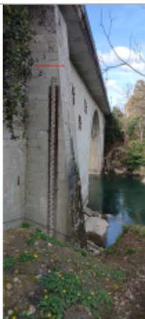
Vue du repère (le trait rouge représente le niveau atteint pas les eaux)

Type de repérage : Source bibliographique