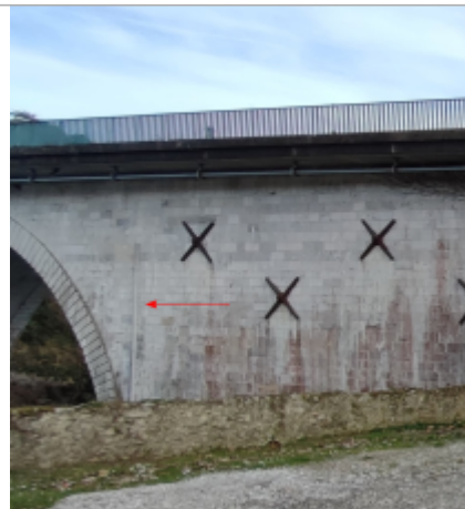
Vue du site (la flèche rouge montre l'échelle de crue)