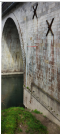
Vue du repère (le trait rouge représente le niveau atteint pas les eaux)

Altitude calculée de l'eau (en m) : 58.07 m