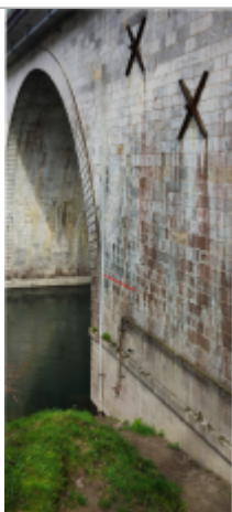
Vue du repère (le trait rouge représente le niveau atteint pas les eaux)