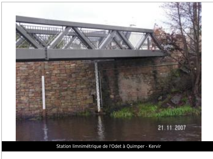
Station limnimétrique de l'Odet à Quimper - Kervir