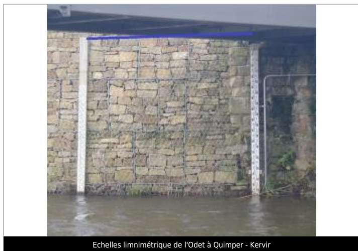
Echelles limnimétrique de l'Odet à Quimper - Kervir