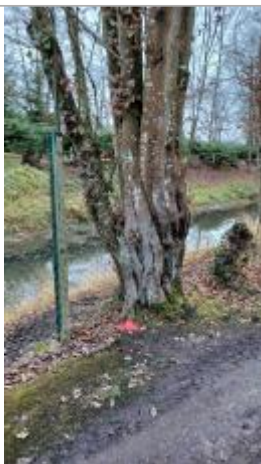
Laisse de crue au pied de l'arbre.

NIVELLEMENT SPC SACN. LE SPC N'EST PAS GÉOMÈTRE EXPERT, LES COTES SONT DONNÉES À TITRES INDICATIF. - 14/12/2021