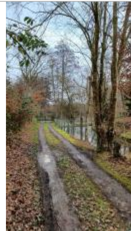
Tronc d'arbre sur le Chemin "Sur Les Près"