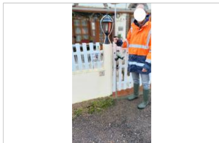
Laisse de crue sur le sol devant portail du jardin

GÉNÉRAL Code : WEB_R_202203082349 Date de mise à jour : 08/03/2022 Auteur : CONTRIB_01