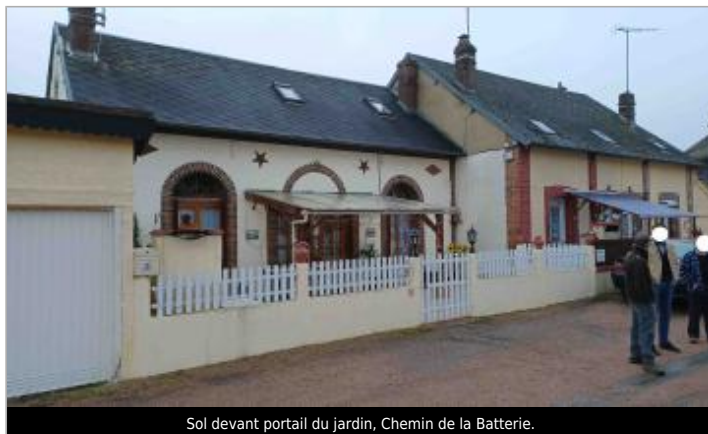
Sol devant portail du jardin, Chemin de la Batterie.