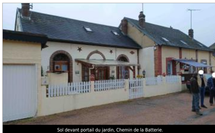
Sol devant portail du jardin, Chemin de la Batterie.

GÉOLOCALISATION Coordonnées WGS84 : X: 0.64799001 / Y: 48.77471700 Coordonnées RGF93 (Lambert 93) X: 527178.59 / Y: 6855309.7 Coordonnées RGF93 (ETRS89) : X: 0.64799 / Y: 48.774717 Code Hydro: H6--0200 Rive de référence: Gauche