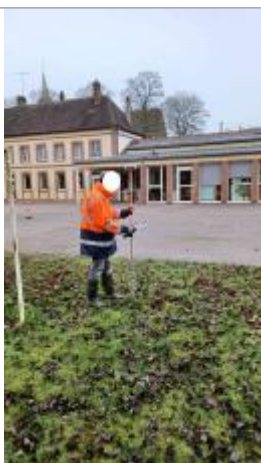
Laisse de crue au sol, sur la partie herbée de la cours.

Altitude calculée de l'eau (en m) : 190.813