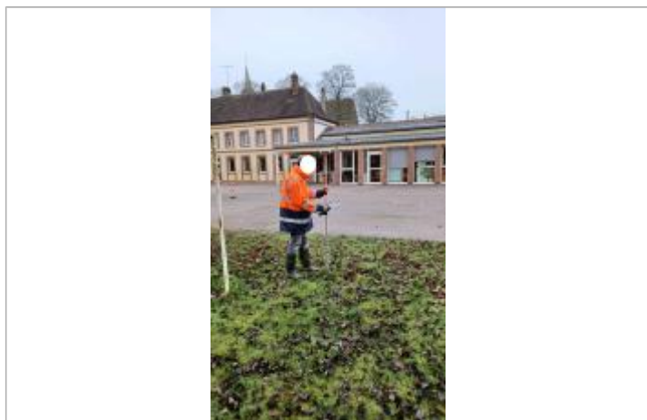
Laisse de crue au sol, sur la partie herbée de la cours.

NIVELLEMENT SPC SACN. LE SPC N'EST PAS GÉOMÈTRE EXPERT, LES COTES SONT DONNÉES À TITRES INDICATIF. - 14/12/2021