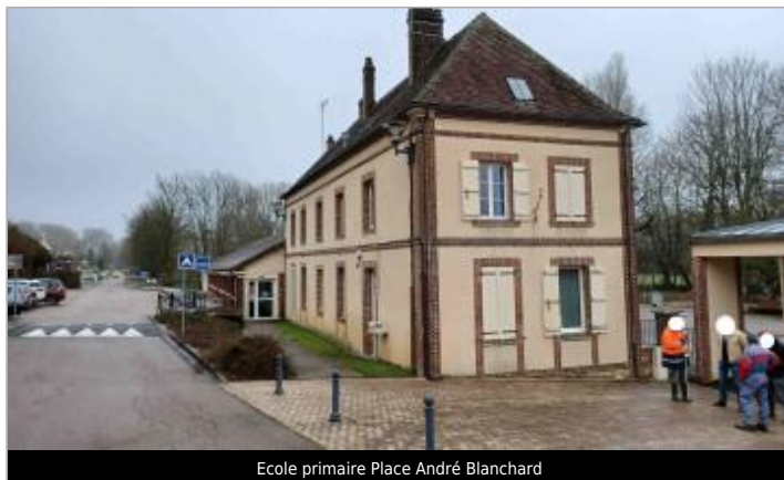
Ecole primaire Place André Blanchard