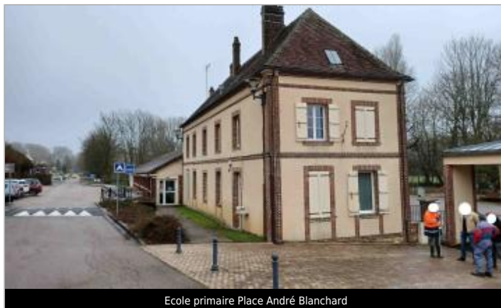
Ecole primaire Place André Blanchard