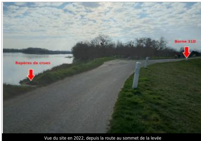
Vue du site en 2022, depuis la route au sommet de la levée