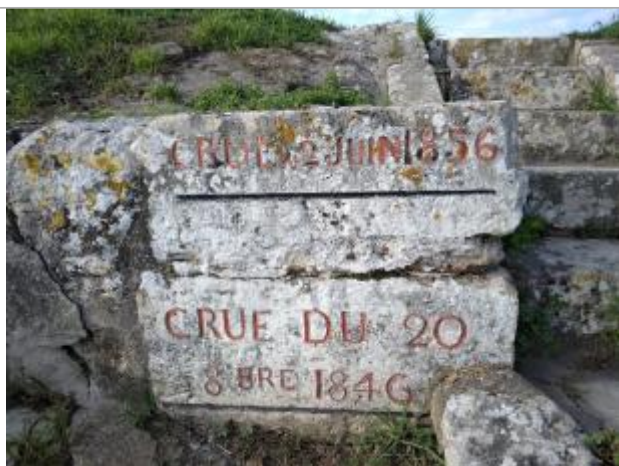
Photo du repère en 2022