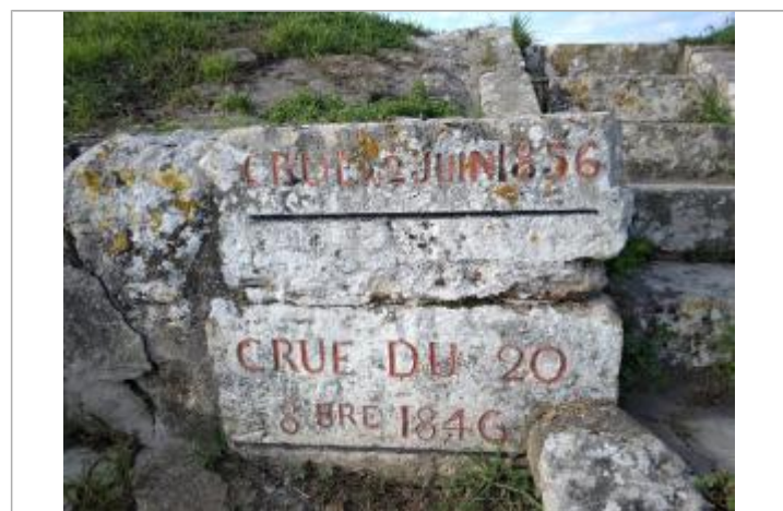
Photo du repère en 2022

MARQUE Texte : CRUE DU 20 8BRE 1846 Maximum de l'inondation : Oui Visibilité : Oui État du repère : Bon Pérennité : Longue