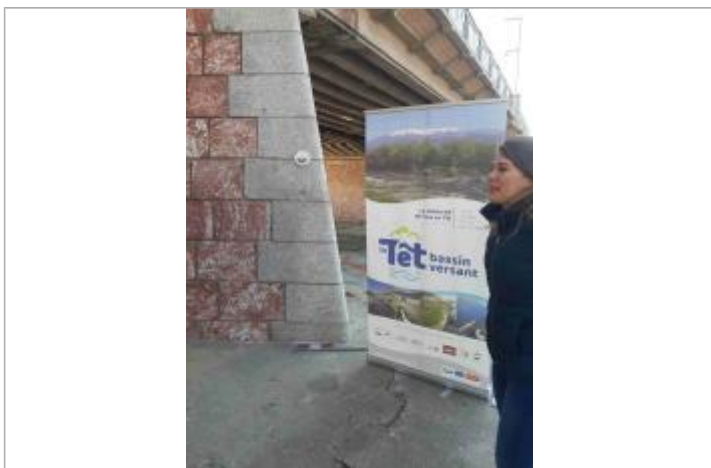
Repère de crue Pont Joffre - rive Gauche

Maximum de l'inondation : Oui Visibilité : Oui État du repère : Bon Pérennité : Longue